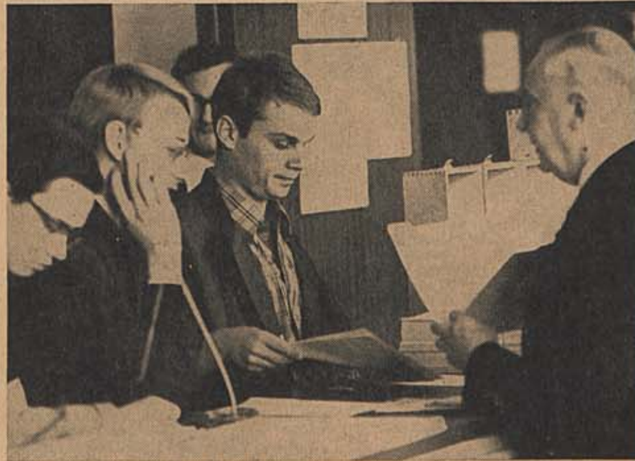
WENN DER RUN AUF DIE RUHR-UNIVERSITÄT weiter anhält, sind zum Wintersemester mit Sicherheit weit über 6000 Studenten zu erwarten. Die Abteilungen zittern aus Furcht vor Überfüllung — und die Studenten zittern vor der trotz Massenansturm befristeten Studiengänge.