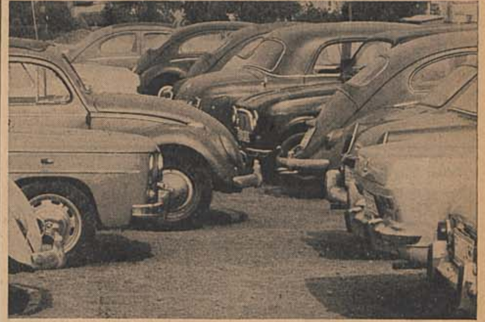
GENÜGENDE PARKPLÄTZE seien an der Ruhr-Universität vorhanden, behauptet die Verwaltung aufgrund einer Auszählung im Juli dieses Jahres.

Da das Studentenparlament die Universitätsverwaltung im vergangenen Sem-