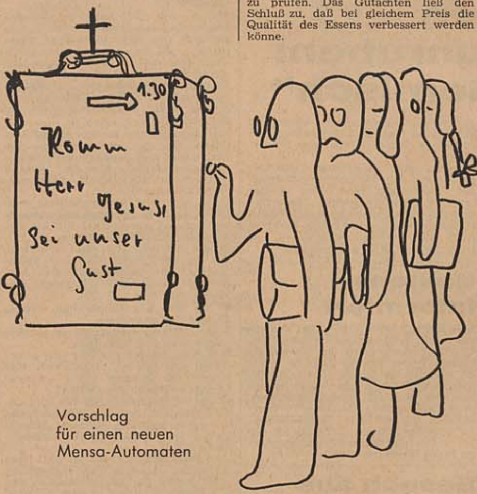
Vorschlag für einen neuen Mensa-Automaten