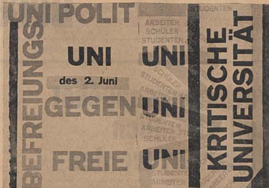
Das Umschlagbild des Vorlesungsverzeichnisses der Kritischen Universität.

Die Berliner Studentenvertreter sind in den letzten Monaten offenbar entnervt worden; das ist eine Folge der rein bürokratischen Maßnahmen gegen sie. Der SHB-Bundesvorstand will zur Stilllegung der Studentenparlamente und der ASTAs aufrufen und zur Gründung einer Kritischen Universität auf Bundesebene auffordern, „falls bis zum 31. Dezember die Hochschulreform nicht wesentliche Fortschritte gemacht“ habe.