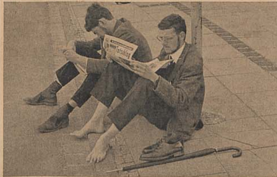
Bochumer Studenten während des Studentenkongresses am 9. Juni in Hannover: die Bürger wundern sich, warum sie auf die Straße gehen.

HEINRICH ALBERTZ, Pastor a. D., Regierender Bürgermeister, am 4. 6. (nach DIE WELT, 5. 6.)