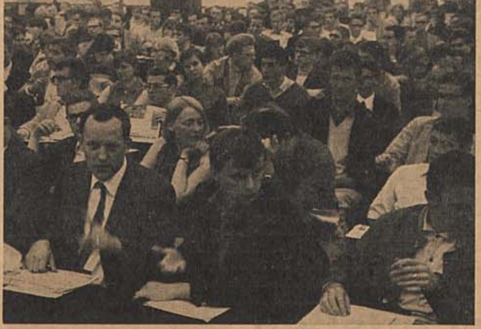
Aktiv am Wahlkampf beteiligten sich meistens nur die Angehörigen der Wahlgemeinschaften und ihr engerer Anhang.

Zweitstärkste Gruppe wurde die Wahlgemeinschaft Unabhängiger Studenten mit 15,4 Prozent. Erstaunlich, daß der SDS mit 13,1 Prozent soviel Wähler hinter sich hatte wie die völlig unpolitische Wahlgemeinschaft des Bundesverbandes Deutscher Volks- und Betriebswirte (BDV). Danach folgen die Action Bochumer Studentenschaft (ABS) mit 10,9 Prozent, Ring Christlich-Demokratischer Studenten (RCDS) 10,1 Prozent, Liste Unabhängiger Studentengemeinschaften (LUS) 7,8 Prozent, Gemeinschaft Unabhängiger Studenten (GUNST) 6,8 Prozent. Der Quotient für einen Parlamentssitz betrug 112 (er ergibt sich aus: Gültige Stimmen = 2694 geteilt durch Zahl der Listenplätze = 24). LUS und RCDS errangen kein Direktmandat, dafür die ABS gleich zwei, alle anderen Wahlgruppen je eines. Auf die Reststimmen erhielten noch einmal LUS, „WUS“, GUNST und ABS je ein sogenanntes Überhangmandat. Außerdem rückten fünf Kandidaten ins Parlament ein, die keiner Gruppe angehörten. Der SHB, SDS, die ABS und LUS bildeten kurz nach der Wahl eine Koalition mit absoluter Mehrheit im Parlament und handelte in zähen Gesprächen über das Wochenende bis zur ersten Parlamentsitzung Programme und Personen aus. Die Wahlbeteiligung von 54,15 Prozent kann als gut bezeichnet werden; sie liegt erheblich über dem, was von anderen Studentenwahlen an westdeutschen Universitäten in der letzten Zeit gemeldet wurde.