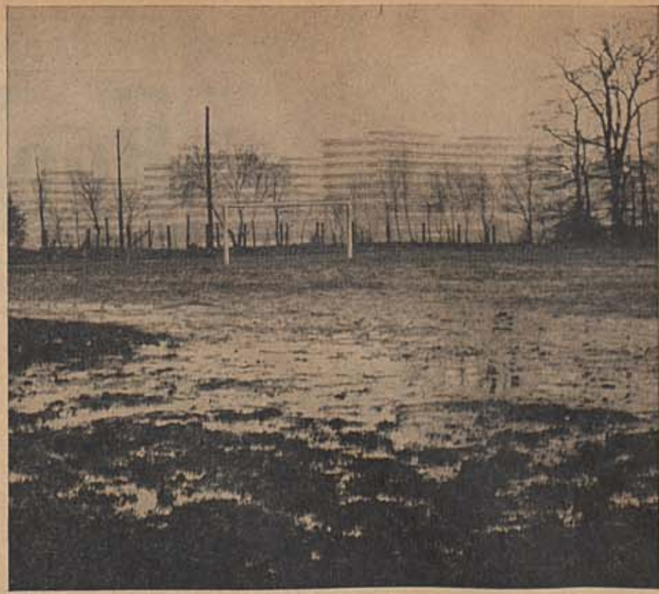
BIS 1970 herrschen trübe Aussichten für Sportstudenten an der Ruhr-Universität.